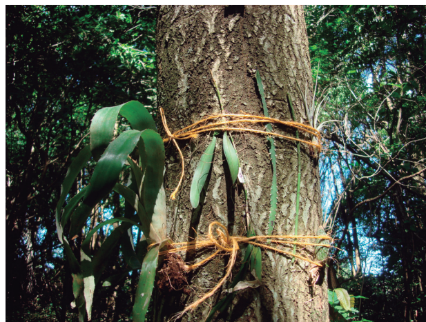
Figura 2: Transplante de epífitas a tronco de forófito. Iracemápolis, SP, Brasil.

As análises foram embasadas em Gotelli & Ellison (2012) e realizadas no software R (R Development Core Team 2011).